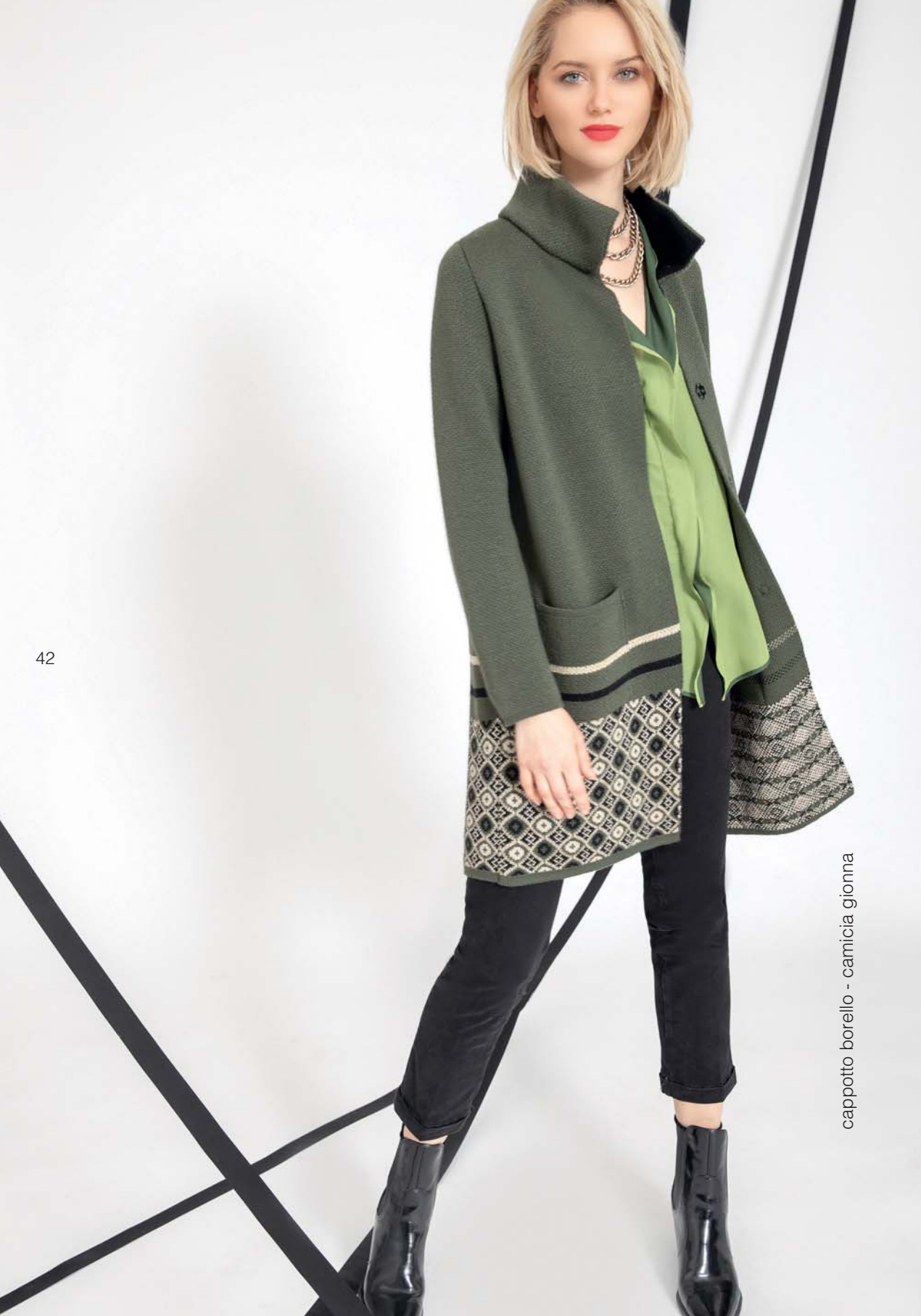
cappotto borello - camicia gionna