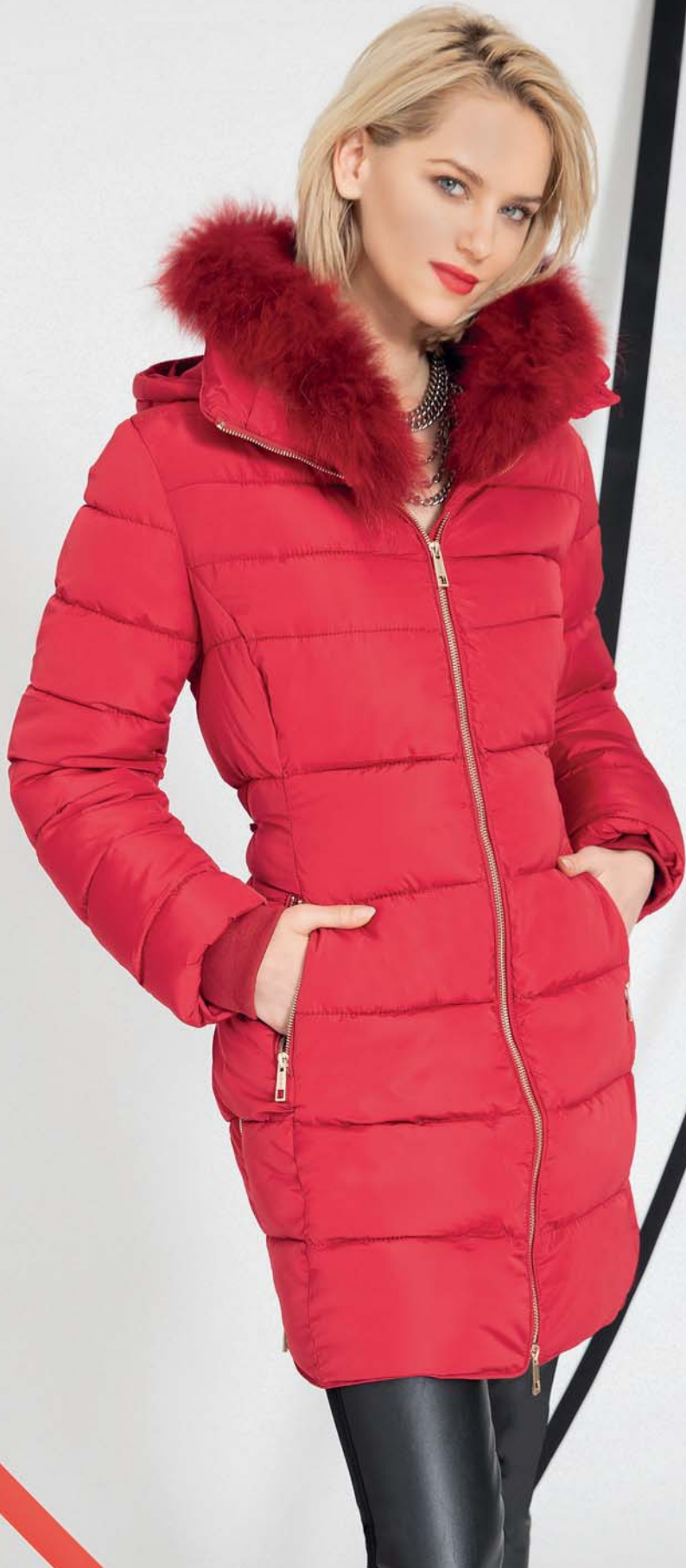
piumino pamino - pantalone sebaldo