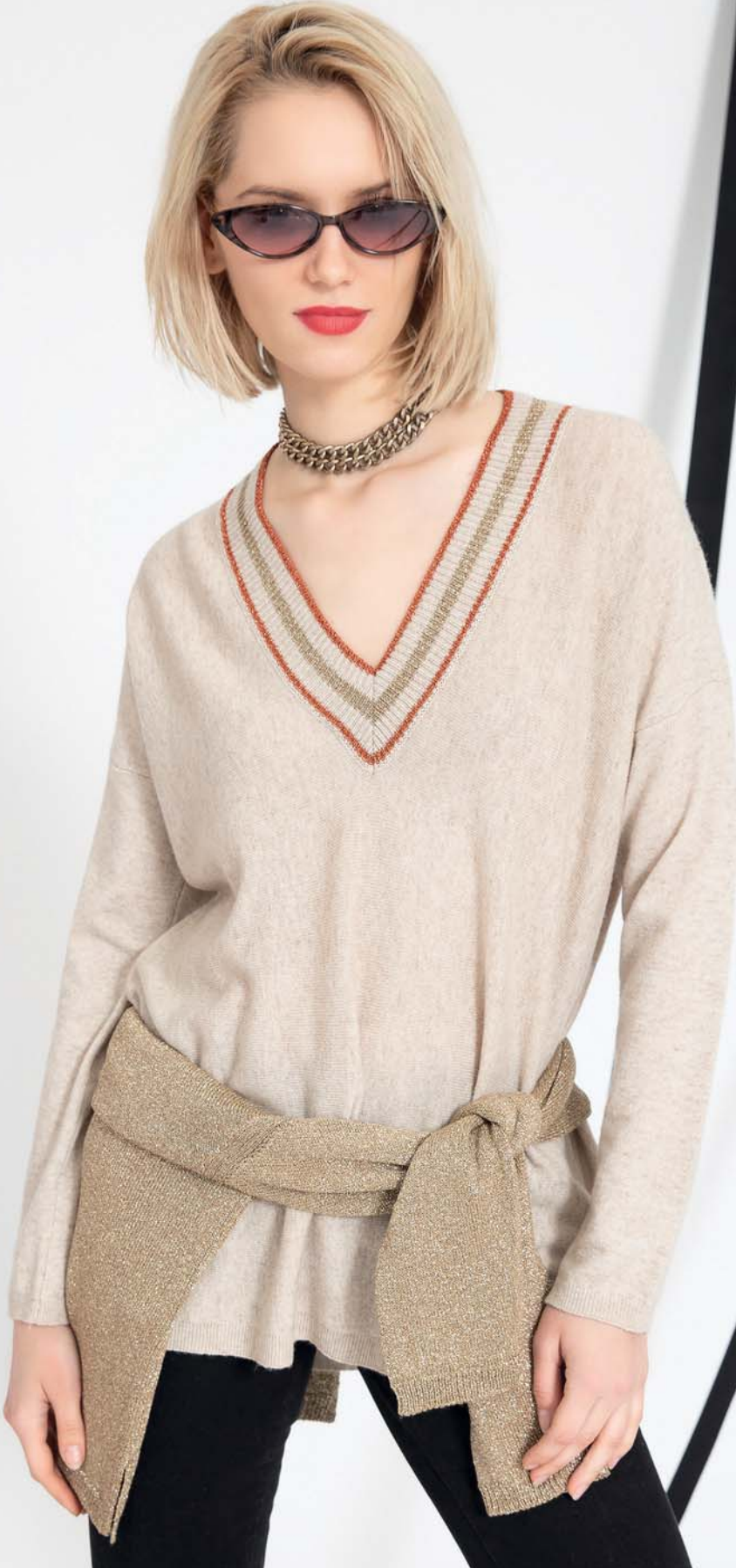
maglia ranina - (maglia in vita) linetta