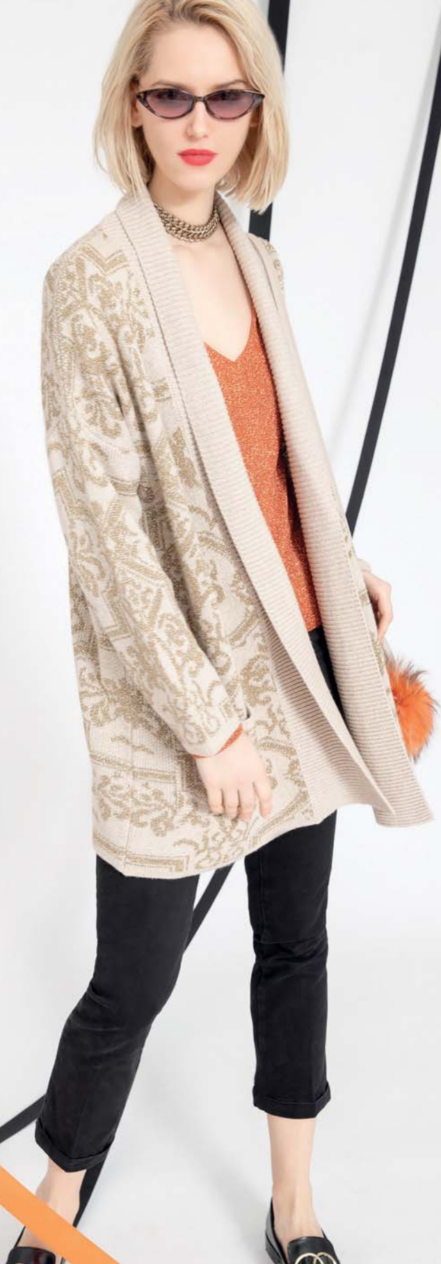
cardigan bastiana - maglia loretta