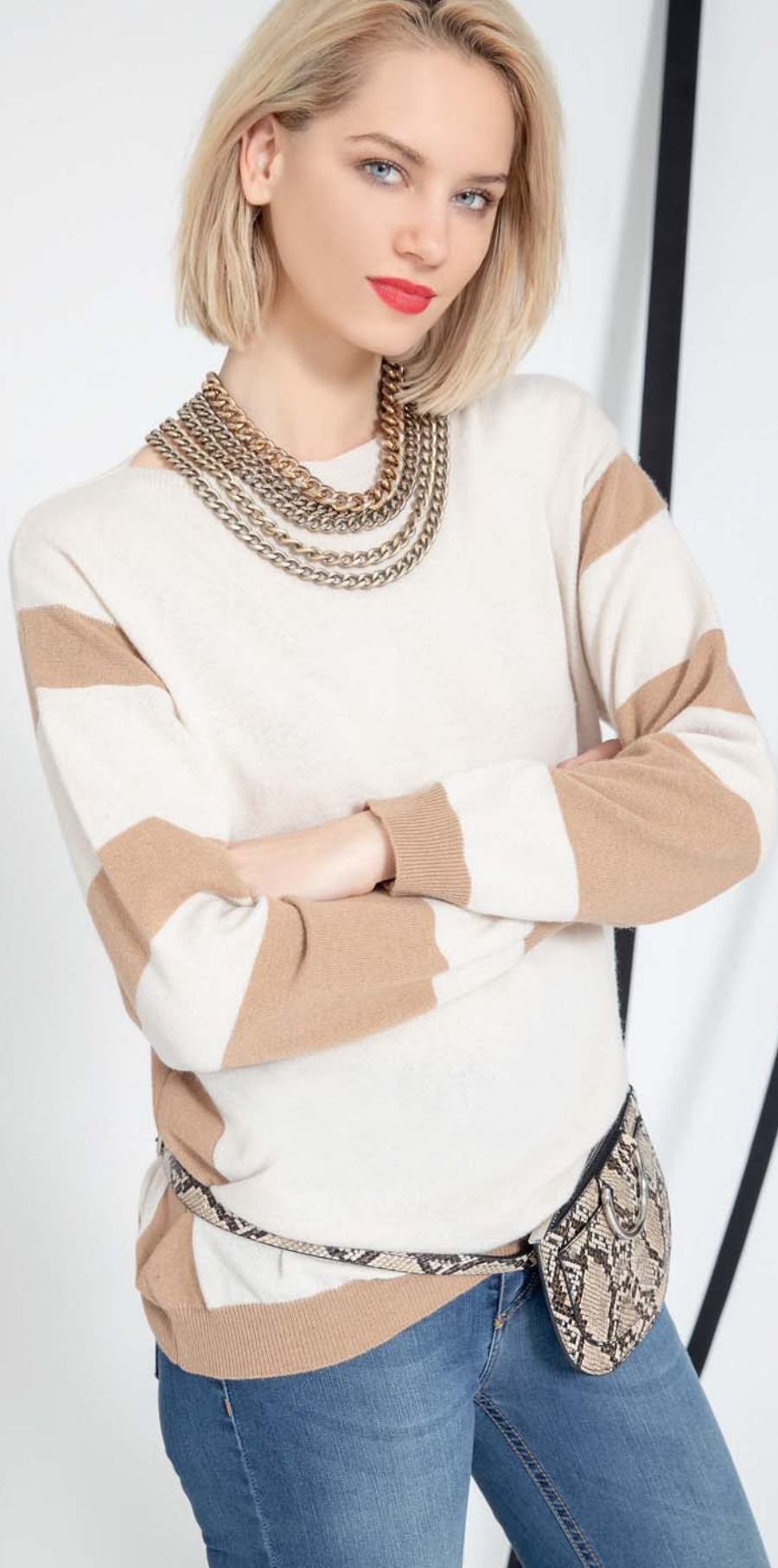
maglia cinese - jeans jacob