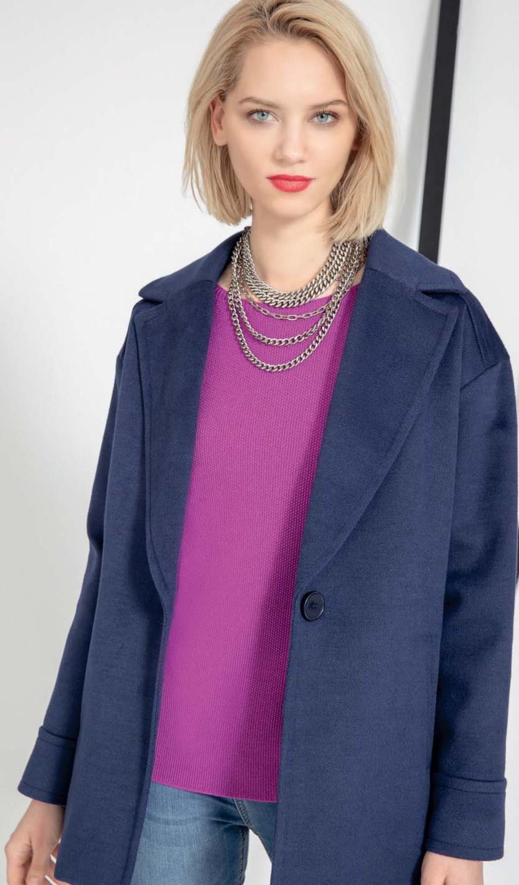
cappotto celei - maglia pincos - jeans jucob